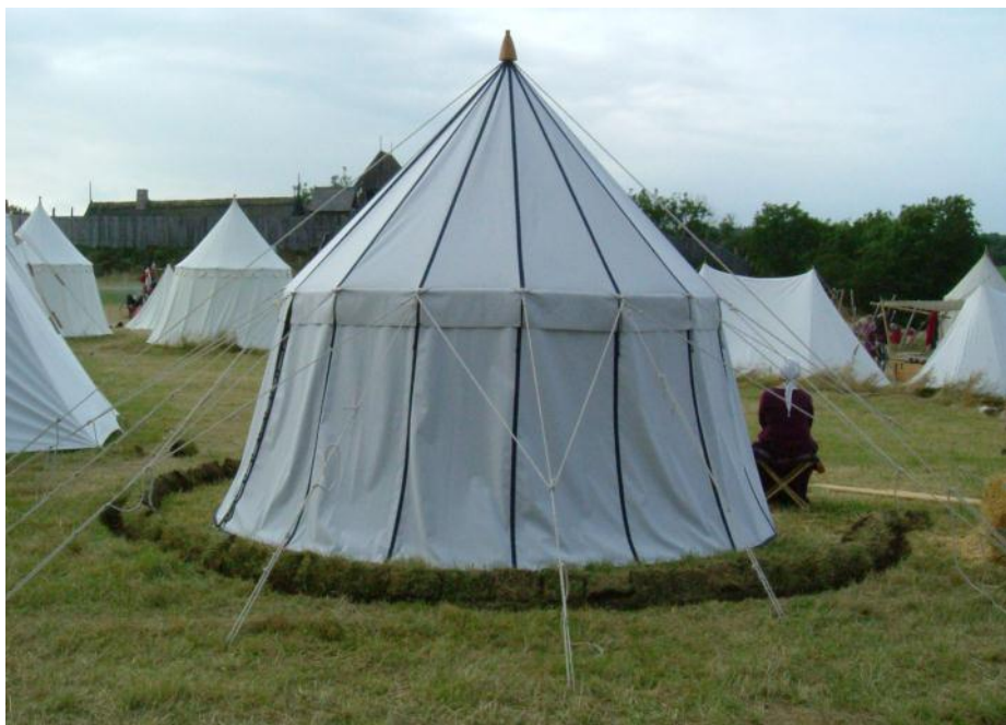
2007 i väntan på stormen

När vi satt inne i vårt tält på natten hörde vi de sju små dvärgarnas sång i stormvinden. Det var några polacker som hade givit upp alla försök att rädda sina tält och gick nu runt med spade och hacka för att hjälpa dem som ännu hade uppresta tält. Vi hörde att någon rensade vår gröft när den höll på att svämma över. När morgonen till sist kom kunde vi konstatera att tältet hade klarat stormvinden och regnet. Det var torrt inne i tältet och vi kunde börja ta in all utrustning från bilen.