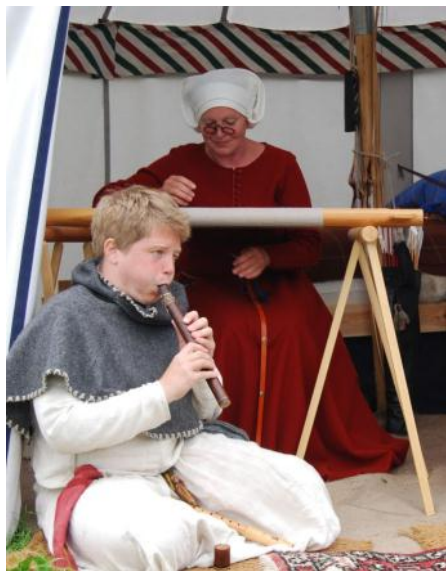
2011 mys i tältet

Det sjunde året gjorde vi om processionen, men utan kör, för den här