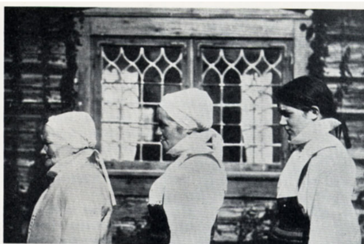
Fig. 121. Morakvinnor, tre generationer. Flickan har håret lindat med röda band, vilka hänga i en lycka i nacken, modern och mormodern bära båda hustruhatten, vilken är bunden med band framom flätorna, vilka avteckna sig under hatten. — Samtliga bära det gamla halsklädet med krage, mormodern också vittröja.

Hattarna ha nedtill en dragsko med ett vitt band indraget. Med dessa band drogs hatten ihop i nacken, varefter banden drogos framåt och över hårfästet i pannan, korsades, drogos bakåt och knöts med en lycka ( slumplucka ). Denna och bandändarna voro så långa, att de hänga ett gott stycke nedåt ryggen.